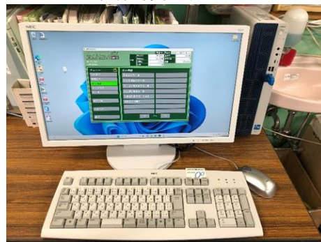
パソコン (POSシステム販売管理ソフト含)