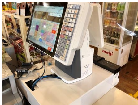
対面型セミセルフPOSレジ (Web3800T)